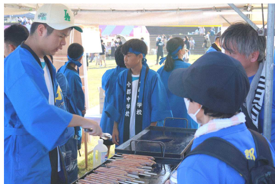
<小郡中学校の模擬店とPTAと共に活躍する中学生>