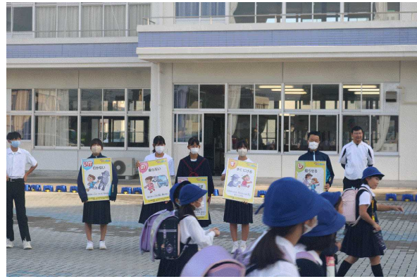
＜近くの小学校であいさつ運動＞