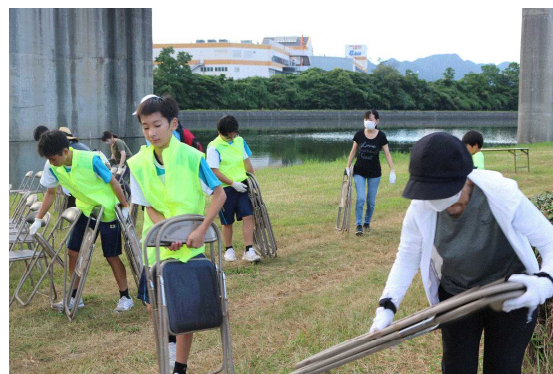
<地域の方と一緒に、祭り後の片付けや清掃活動を実施>