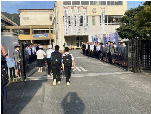
＜中学校の正門で高校生とあいさつ運動＞